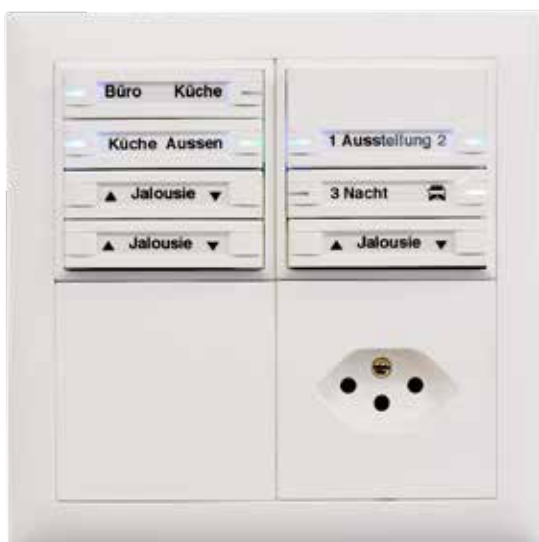
KNX-Bedienstelle für Licht und Storen.

Dank guter Schulung und einfachem Handling konnte der Bauherr die Umstellung problemlos hinter sich bringen. «Es ist normal, dass nach ein paar Wochen Erfahrung Feinissen korrigiert werden müssen. Aber mit KNX ist das einfach und ohne Verkabelung möglich», erklärt BW Elektro die ersten Wochen.