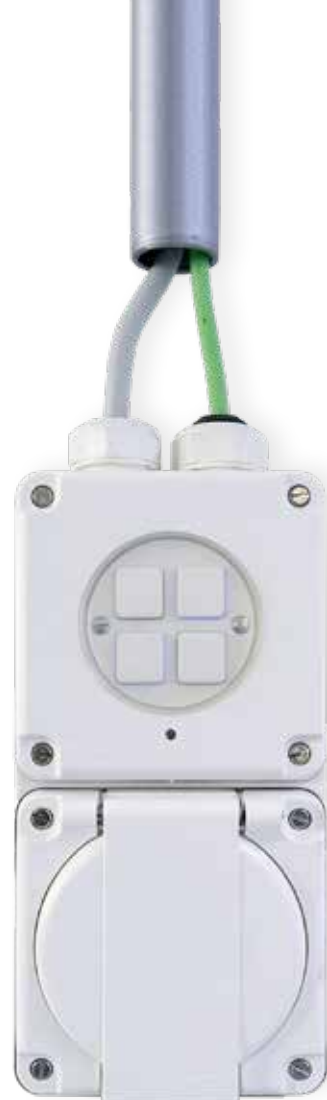
Mit aktivem Feuchtigkeitsschutz. Der NAP KNX Nasstaster.