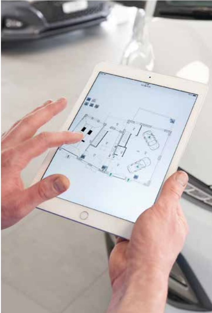
Übersichtliche Visualisierung des Gebäudes. Realisiert mit fellerLYnk.

So fällt auch das Gesamtfazit aller Beteiligten vorbehaltlos positiv aus. Positiv aus funktionaler wie auch aus wirtschaftlicher Optik. Denn mit einem Anteil von rund 5 bis 10% am Gesamtbudget für den Erweiterungs- und Neubau sind die Kosten für die ganze Installation im Rahmen geblieben. Das gilt auch für die Programmierung. Dank fellerLYnk ist diese einfach zu vollziehen und es fallen weniger Stunden für Programmierung und Änderungen an.